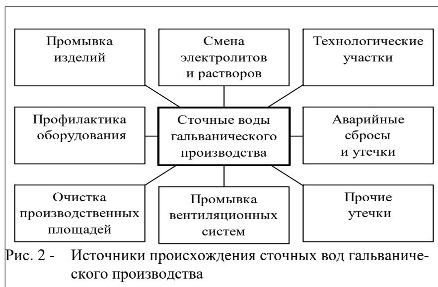
Рис. 2 - Источники происхождения сточных вод гальванического производства

Происхождение, качественный и количественный состав сточных вод зависит от состояния и вида гальванического производства. По происхождению сточные воды отличаются составом, количеством, агрессивностью и т.п. Источники происхождения сточных вод гальванического производства